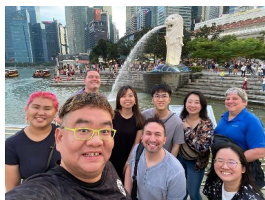
アメリカからのゲストコンダクター1名とアメリカから2名、香港から3名、日本から1人のゲストリンガー。