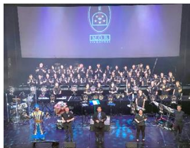
コンサート会場での集合写真。リンガーと指揮者の他にショーの物語を進行する俳優さんとエレクトーン奏者さんも一緒に。