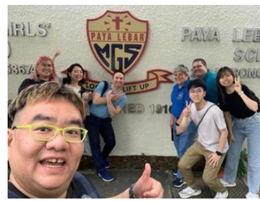
平日には地元の小中高ハンドベルクラスの見学に。シンガポールで最初にハンドベルをはじめた Paya Lebar Methodist Girls' School の小学校での写真