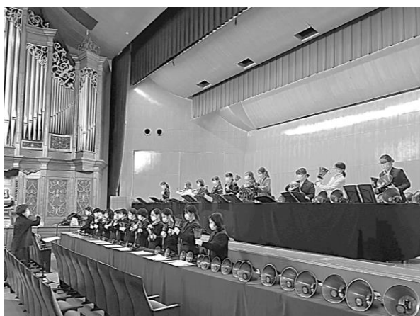
コンサートリハーサル時↑