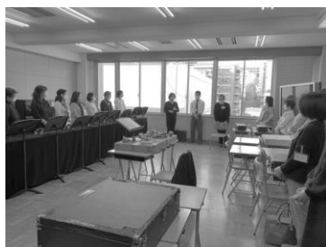
開会式、閉会式の様子。